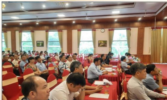
Phối hợp cùng Viện chăn nuôi đưa tiến bộ khoa học vào phục vụ chuỗi chăn nuôi bò thịt chất lượng cao tại Việt Nam