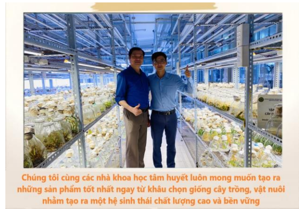
Chúng tôi cùng các nhà khoa học tâm huyết luôn mong muốn tạo ra những sản phẩm tốt nhất ngay từ khâu chọn giống cây trồng, vật nuôi nhằm tạo ra một hệ sinh thái chất lượng cao và bền vững