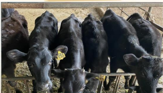
Giúp những trang trại điển hình trong chuỗi liên kết tiếp cận việc làm quen chăm sóc bò Wagyu Nhật Bản để đảm bảo chất lượng tốt nhất