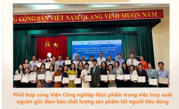
Phối hợp cùng Viện Công nghiệp thực phẩm trong việc truy xuất nguồn gốc đảm bảo chất lượng sản phẩm tới người tiêu dùng