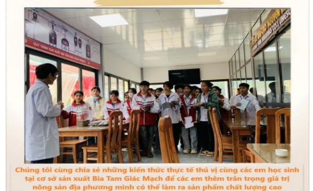
Chúng tôi cùng chia sẻ những kiến thức thực tế thú vị cùng các em học sinh tại cơ sở sản xuất Bia Tam Giác Mịch để các em thêm trân trọng giá trị nông sản địa phương mình có thể làm ra sản phẩm chất lượng cao